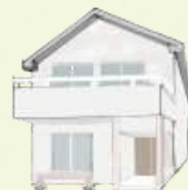
空家等の発生予防