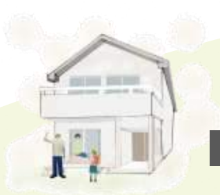
居住中の住宅の管理