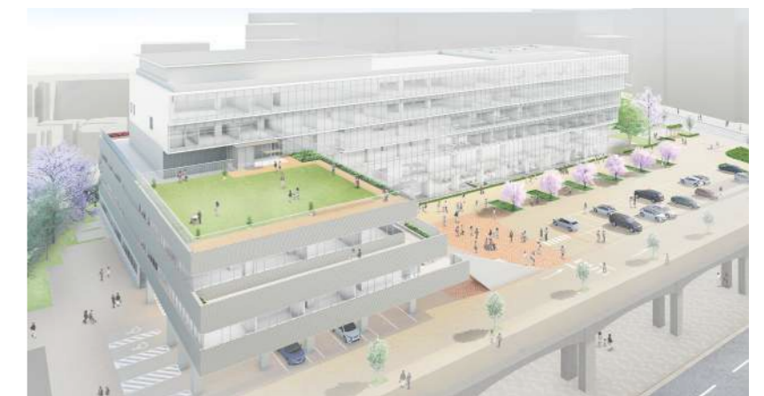
庁舎と(仮称)新福祉社会館が重ね合わさり構成される外観イメージ