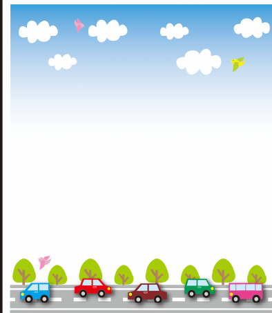
古紙を配合しています

都市計画道路3・4・8号線は一部の区間を除いて道路は完成しております。 都市計画道路3・4・9号線は、今年度に梶野町交差点の整備と東側歩道設置を行っております。電柱及び信号機の移設等を行った後に車道整備を行い、東側の歩道の区間については開放する予定です。 都市計画道路3・4・16号線は建物移転を行い、東側から順次整備に着手しています。 今後、各都市計画道路の歩道は電線共同溝の設置や植栽等の整備を行う予定です。