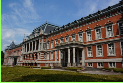
法務省赤れんが棟

人権擁護委員制度は、昭和23年7月17日に公布・施行された人権擁護委員令によって誕生し、平成30年で70周年を迎えました。