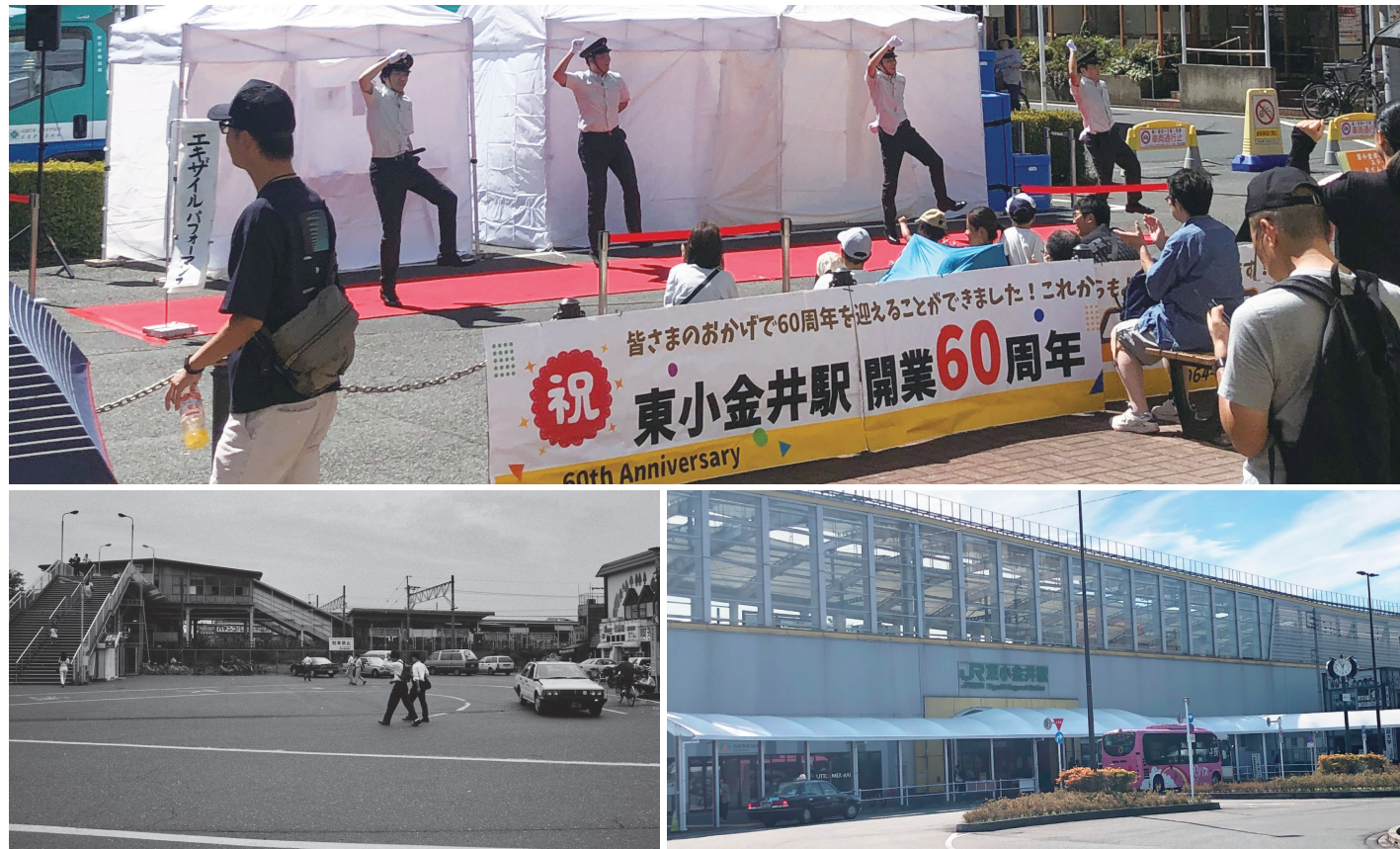
9月10日に開業60周年を迎えた東小金井駅（上部：60周年記念イベント、左下：旧駅舎、右下：新駅舎）