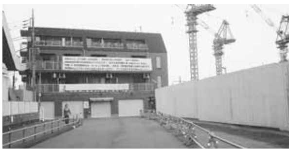
一部権利者を無視し裁判中の再開発