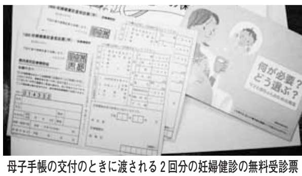
母子手帳の交付のときに渡される2回分の妊婦健診の無料受診票

②災害に強いまちづくりをすすめるため、(ア)指定避難所の数は多摩平均水準に引き上げないか。(イ)要介護者、障害者、人口透析や肺気腫など要援護者への対応を関係機関とすすめないか。(ウ)高齢者世帯への家具転倒防止金具の設置助成をすすめないか。