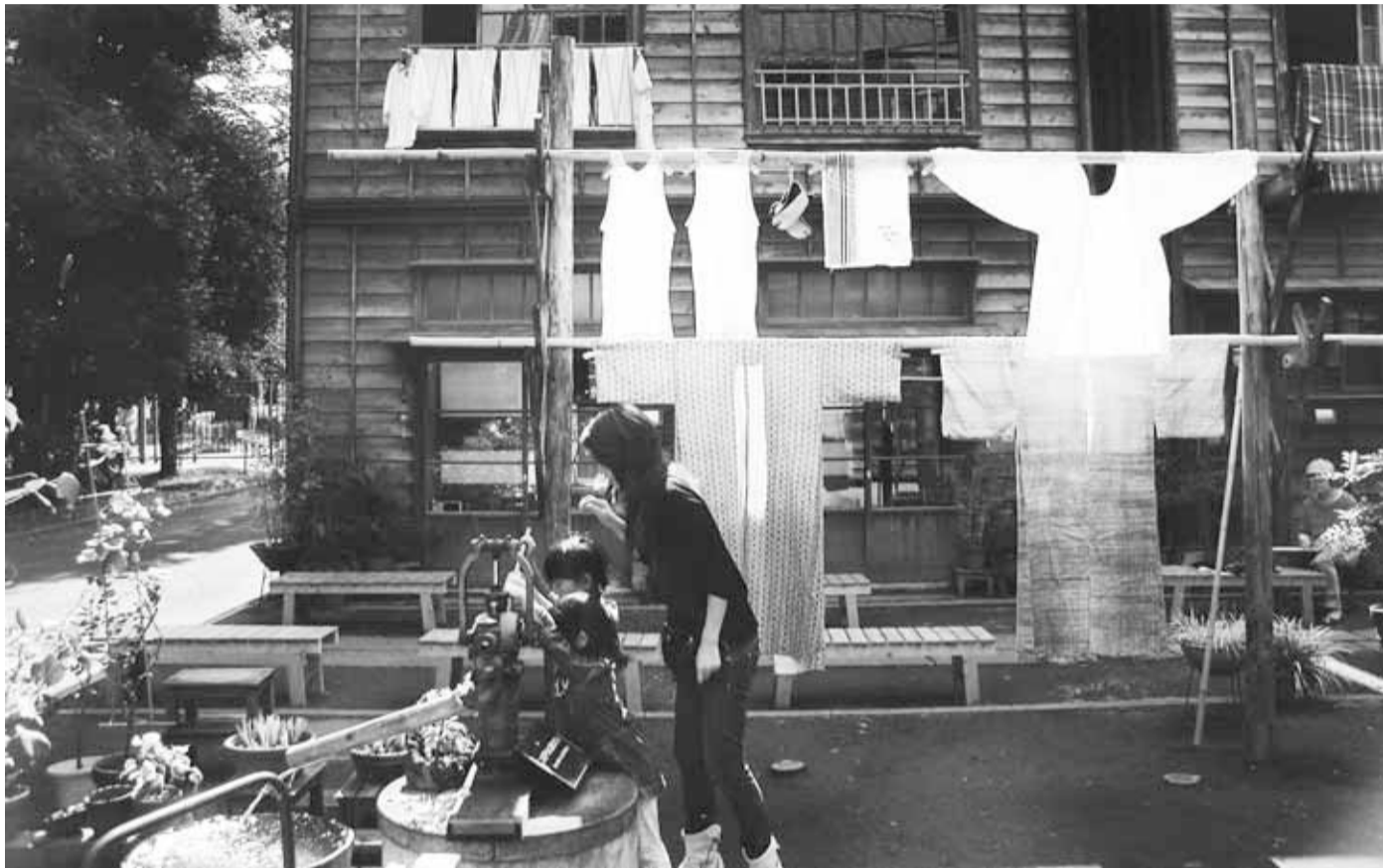
江戸東京たてもの園で行われている「干し物プロジェクト」