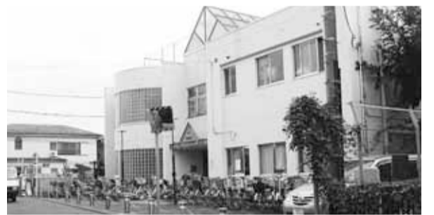
充実が望まれる学童保育所