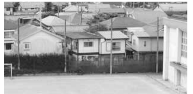
野球にサッカー、ボールをキャッチ、防球ネット!

た。(ア)第二庁舎のエレベーター使用は4階からにしてはどうか(高齢者や障害者等それなりの理由がある場合は別)さらに階段の入口を分かりやすくすべきだ。(イ)太陽光発電や風力発電利用者への支援、補助金制度をつくるべき。 環境部長 (ア)4階からのエレベーター利用等については、職員の理解を頂き対応する。(イ)金利の助成制度はあるが、ほとんど利用されていない。 ■ 前原一、二丁目、中町一、四丁目のココバス運行を願う。