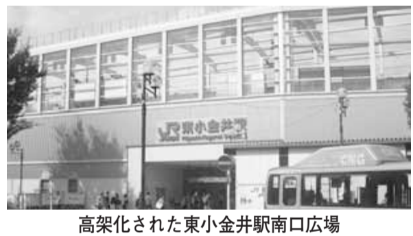
高架化された東小金井駅南口広場