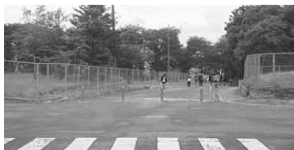
貫井北町国家公務員住宅の建設予定地

し、適切に対応したい。 ③ 仙川南側の残った公務員住宅宿舍の今後の利用計画は。企画政策課長 平成19年度に廃止し、北側同様に宿舍が建設されると聞いている。 ④ 近隣の商店街は住民退去後疲弊しています。早めに正確な情報提供をお願いしたい。 企画財政部長 財務局に丁寧な説明会開催を要望する。 ■ その他に、上水公園グラウンドの少年用サッカーゴールポストを新規購入するように要請した。