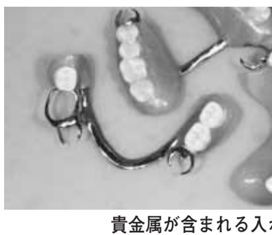
貴金属が含まれる入れ歯