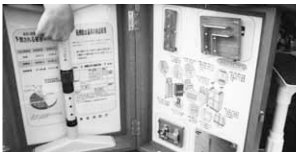
総合防災訓練で展示された転倒防止器具

改善してほしい。(オ)開館前の作業を見直して、現在の10時間開館を早めないか。 図書館長 (ア)昭和50年にオープン以来、蔵書は約4・6倍になり、他市と比べても高密度になってスペースに余裕がなくなった。本の除籍を実施し、ゆとりを作りたい。椅子の件は工夫してみたい。(ウ)団体利用は多いが個人利用が少ない。周知をし利用促進をしたい。(エ)調査し改善したい。(オ)開館準備作業を見極め、検討課題としたい。