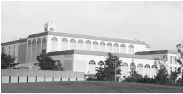
西多摩衛生組合(羽村市)の外観