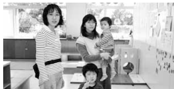
子ども家庭支援センター

②(ア)15年度からの入札制度改革の実績は。(イ)施設サービス公社の業務委託は落札率がほぼ100%。5年以上同一者がやっているが、予定価格の事前公表などの工夫を。(ウ)障害者雇用拡大のために、入札における加点や随意契約拡大の総務省新見解の活用を。 管財課長 (ア)4件の制限つき一般競争入札は、平均落札率が82・2%になった。 環境部長 (イ)検討する。 総務部長 (ウ)国から通知が来た段階で十分に考慮したい。