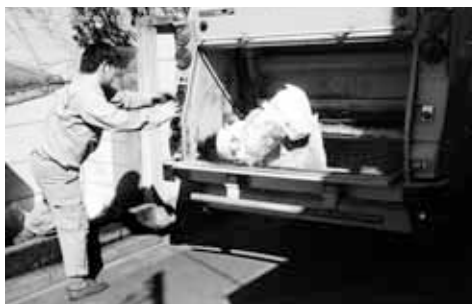
みんなの意識でゴミ減量を