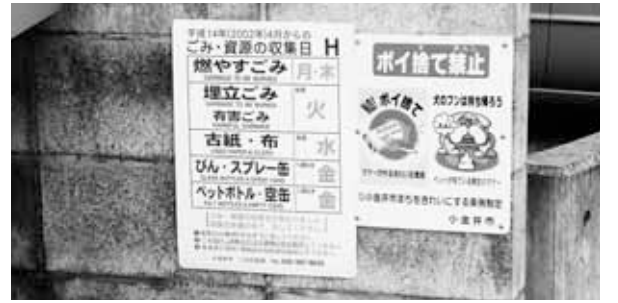
ごみの分別を進めよう