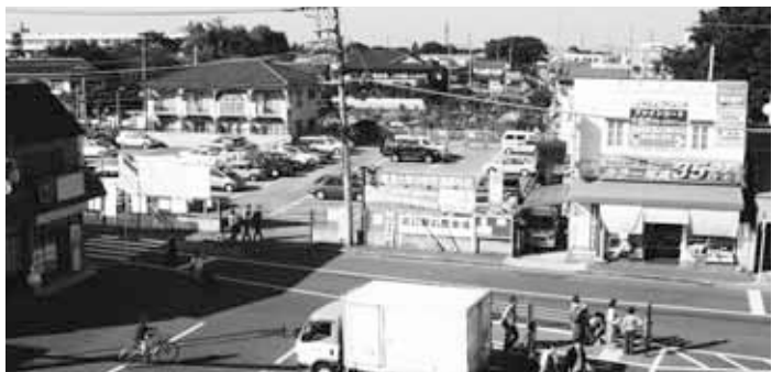
数(賛成22・反対1)で原案可決しました。