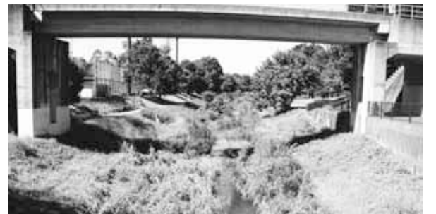
台風で濁水に一息(10月15日)

福祉保健部長 (イ)利用料負担の低所得者対策の抜本的措置を国に要望したい。保険料の負担は現在5段階であるが、段階を増やす検討をする。