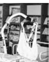
在宅介護支援センターがあるつきみの園(中町二丁目)

福祉保健部長 (ア)武蔵野市から話があったのはいつか。(イ)武蔵野市では、地域や商店の方々に情報を知らせ、意見を求めている。小金井では、全く話がないまま了承となったのか。