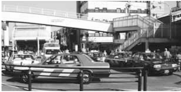
現在の武蔵小金井駅南口広場