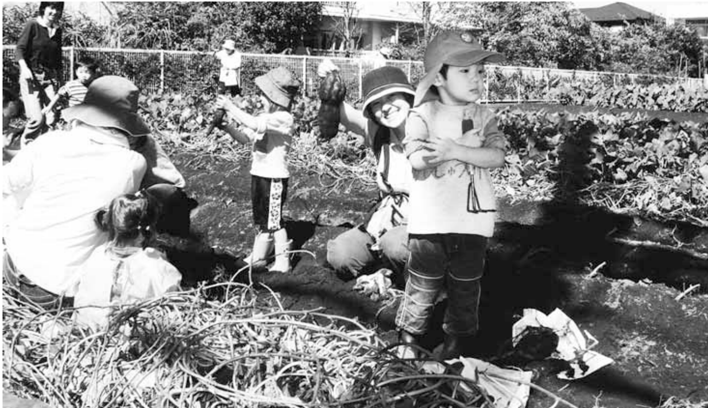
おいしそうな芋がとれました! ~本町児童館の幼児グループの行事から~