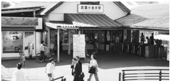
予算審議の争点となった武蔵小金井駅南口周辺①と東小金井駅北口周辺②

内容は、武蔵小金井駅南口再開発事業や東小金井駅北口土地区画整理事業の関連予算等の経費について、議会多数と関係者の理解を得るまで予算の年度内執行を凍結するよう求める決議であり、賛成多数(賛成22・反対1)で原案可決しました。