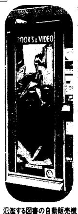
犯さず図書の自動販売機

東京都は昭和39年8月に「東京都青少年の健全な育成に関する条例」を制定した。しかし、その後の社会構造の変化により、青少年を取り巻く環境は条例制定当時とは考えられなくなった程に悪化している。しかるに都の各種条例は実情に的確な対応ができ得る内容となっていないため、環境悪化を放置していると言わざるを得ない。今後、青少年健全育成環境の保全対策のために次の項目について法の整備を求める。 1 違法看板類の速やかな撤去と罰則強化 2 「不健全図書」指定対象の大幅拡充と「略称」都青少年健全育成条例への「緊急指定制度」並びに「直罰制度」の導入 3 (略称)都青少年健全育成条例への「淫行処罰規定」の早期制定