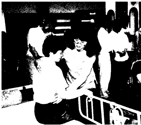
7月1日から業務を開始する福祉社社(研修会場にて)