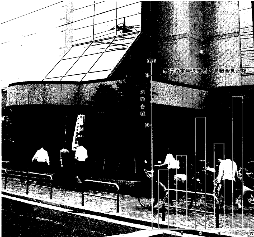
急がれる財政再建 (市役所第二庁舎玄関付近)