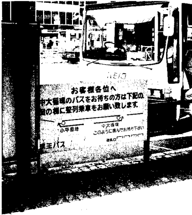
改善された中大循環バス停