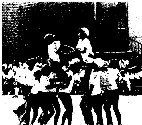
女子体操着(ブルマー)は強制か