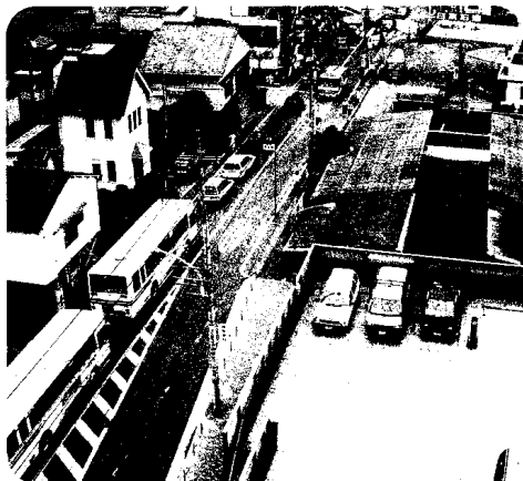
前原坂上交差点付近の歩道整備を