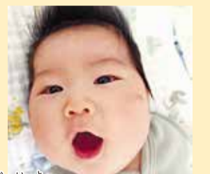
凱仁ちゃん 我が家の天使!♡