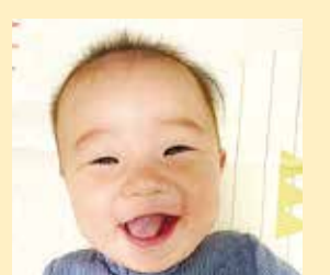
清斗ちゃん いつも癒しの笑顔をお願い!