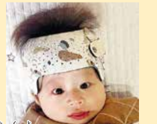
拓都ちゃん ねえと一緒に、よく遊びよく食べよく寝て、楽しそうごそうね!