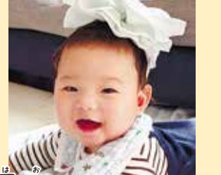
覇央ちゃん 生まれてきてくれてありがとう☆世界で1番の宝物だよ!