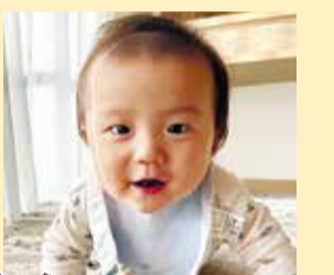
蒼空ちゃん 我が家の癒し系ボーイ! 元気にすくすく育ってね!