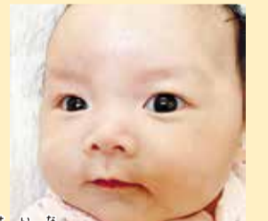
誠菜ちゃん 元気に成長してくれることを楽しみにしてるよ!