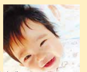
音葉ちゃん お姉ちゃんと仲良くすくすく成長してね♡