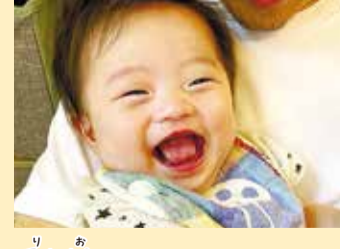
梨緒ちゃん いつもニコニコで癒されています♡!!