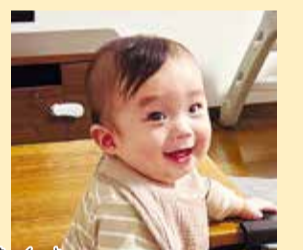
桜叶ちゃん いつもニコニコ、我が家の癒し担当!