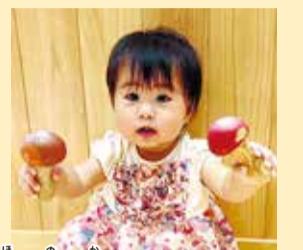
帆乃花ちゃん いつも笑顔をお願い!