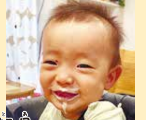
都鬼ちゃん 4074gで大きく生まれ順調に育って来て嬉しいです。