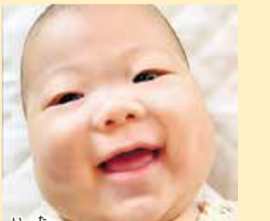
圭汰ちゃん 生まれてきてくれてありがとう。楽しく元気に過ごそうね!