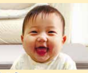
二柳ちゃん 三姉妹の末っ子として遅しく成長中です!