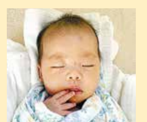
心夏ちゃん おおきく おおきく おおきくなあれ☆