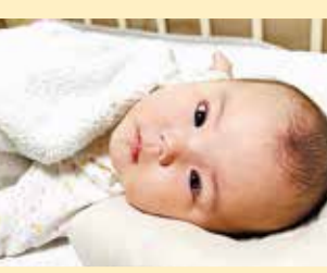
結葵ちゃん お母さんと同じお誕生日に産まれてきてくれてありがとう♡