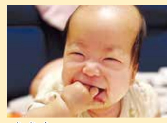
奏向ちゃん ニコニコ