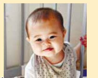
栞由ちゃん お座り上手にできてニコニコ