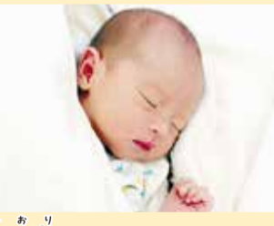
灯織ちゃん 元気に生まれてきてくれてありがとう。いつも癒されてるよ。