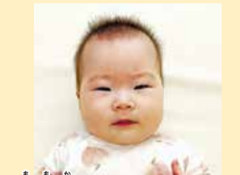
桃糸ちゃん すくすくと成長しているね!