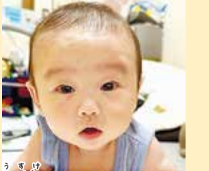
公将ちゃん 毎日笑顔で元気いっぱい! 生まれてきてくれてありがとう! 大好き