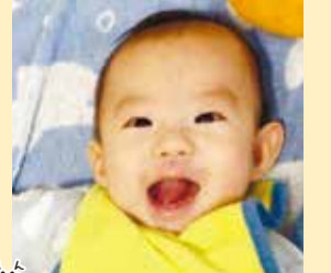
蓮ちゃん 蓮くん 沢山笑って素敵な人生になりますように! 大好きだよ!!