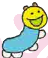
市歌MVイメージ キャラクター 「はけむしちゃん」