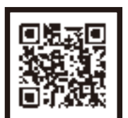
市歌ミュージックビデオ (みんなのぬり絵バージョン)