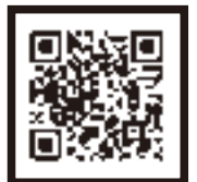
市歌ミュージックビデオ