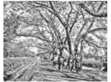
(大正時代)