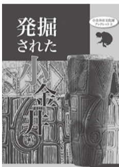
発掘された小金井