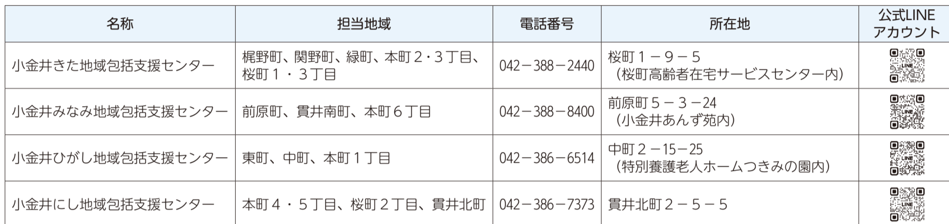
小金井にし地域包括支援センター