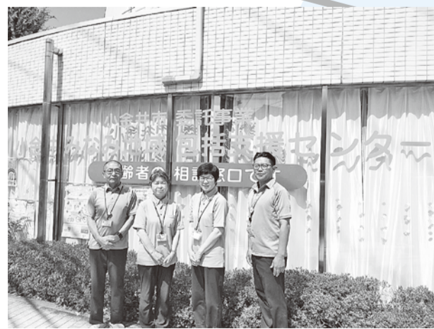
小金井みなみ地域包括支援センター