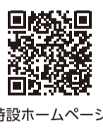
特設ホームページ

前申込。一部公演を除く) 詳細は特設ホームページ (https://39th-japan-saxophone-festival-1.jimdosite.com) をご覧ください 申特設ホームページから問同ホール(☎042-380-8099)