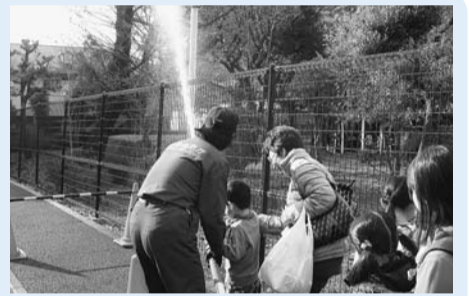
防災訓練のようす