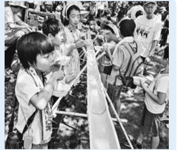
過去の行事のようす