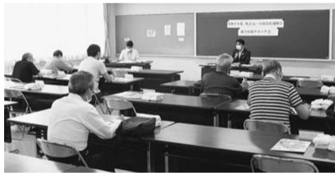
ブロック会のようす

地域を4つに分けてブロックごとに年1回、町会・自治会代表者と市長で意見交換しています。 また、その後、意見等を踏まえた全体会を年1回行っています。全体会には、小金井警察署や小金井消防署からも出席します。