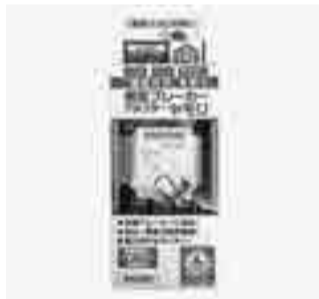
感震スレーカーアダプター