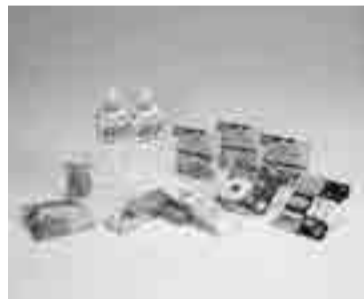
保存食5年セレクトセット