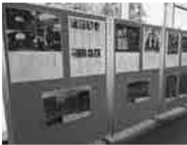
原爆写真パネル展の様子

申 7月19日から、電話、ファクス、Eメールまたは直接、広報秘書課広聴係(市役所第二庁舎1階 ☎042-387-9818 FAX042-387-1224 ✉s010399@koganei-shi.jp)へ