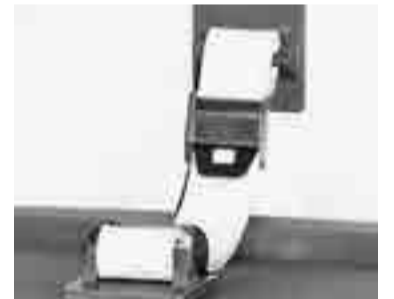
冷蔵庫ストッパー