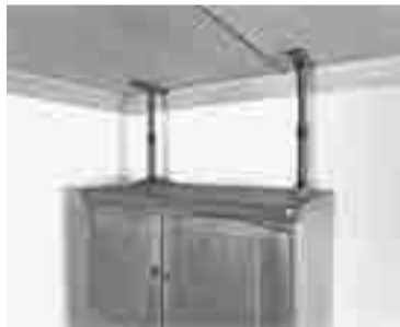
家具転倒防止器具