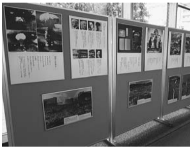
原爆写真パネル展のようす

申 7月19日から、電話、ファクス、Eメールまたは直接、広報秘書課広聴係(市役所第二庁舎1階 ☎042-387-9818 FAX042-387-1224 ✉s.010399@koganei-shi.jp)へ