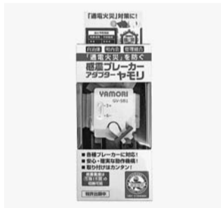
感震スレーカーアダプター