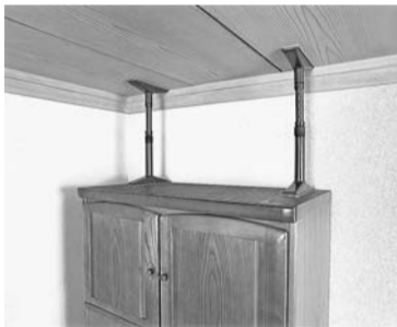
家具転倒防止器具