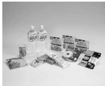
保存食5年セレクトセット