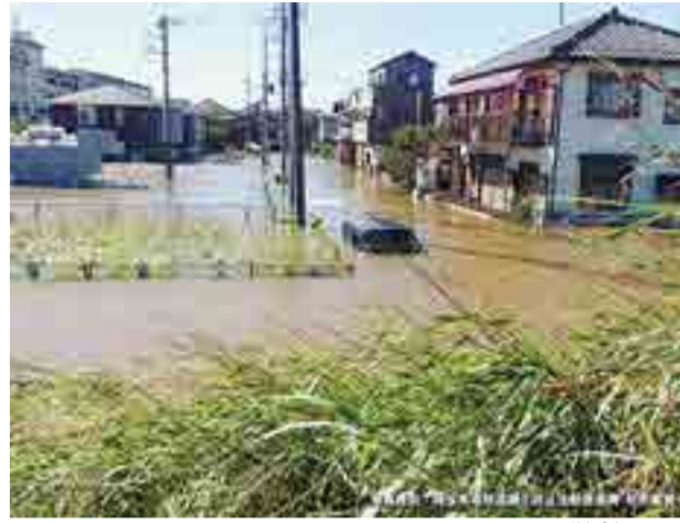
平成29年10月の台風21号で発生した内水氾濫(大雨等の影響で排水路や下水道から水があふれ出すことによって引き起こされる洪水のこと)のようす。