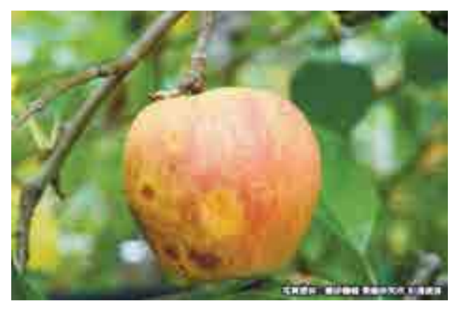
夏秋季の極端な高温で発生するりんごの日焼け。暑い日の昼間に果実の表面が高温になり高温障害が発生する。

今後は気候変動の影響による集中豪雨の増加や大型化した台風の影響、猛暑・酷暑による熱中症搬送者数の増加などが予想されます。地球温暖化の進行を食い止めるため、温室効果ガスの約9割を占めるCO 2 の排出削減の対策を進めることが重要です。本市におけるCO 2 排出量のうち、家庭からの排出は約5割を占めています。今こそライフスタイルを見直し、私たちが生活の中でちょっとした工夫をしながら無駄をなくし、環境負荷の低い製品やサービスを選択することで、CO 2 削減に大きく貢献することができます。