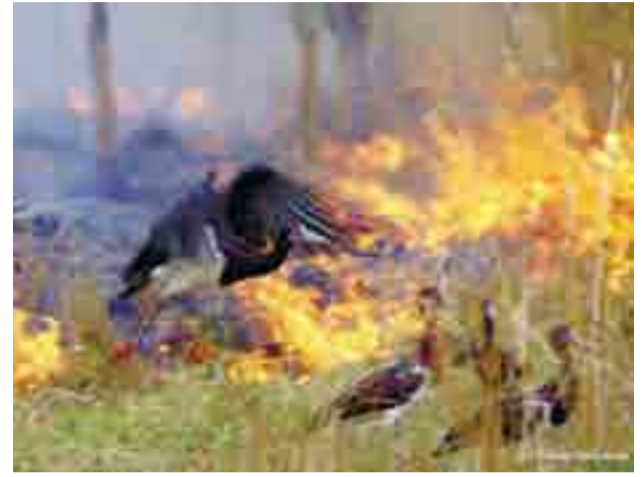
乾期になると乾いたサバンナの草原では火事が起きる。地球温暖化による異常高温・熱波が続くと、火事は燃え広がりやすくなり、そこに生息する生き物は大きな影響を受ける恐れがある。