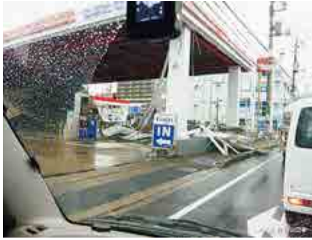
千葉県に大きな被害をもたらした台風15号(令和元年房総半島台風)。記録的な暴風により、外壁が崩れたガソリンスタンドのようす。

地球温暖化の進行がもたらす気候変動による危機は極めて深刻で、私たちの生存基盤を揺るがす、まさに気候危機です。地球温暖化の防止に向けて、今すぐできることから取り組んでいきましょう。