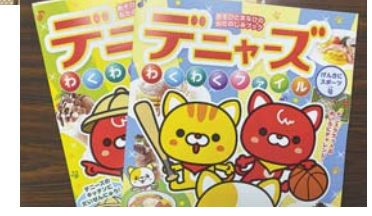
↑子ども向け冊子を使った啓発を行っています