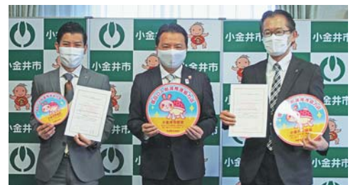
左から小金井南店長、市長、小金井本町店長

食材の種類が多いため、在庫を抱え過ぎないように直近の売れ筋をデータ化し、極力廃棄ロスが出ない仕組みにすることで、より新鮮な状態でお客様へ提供できるよう取り組んでおります。