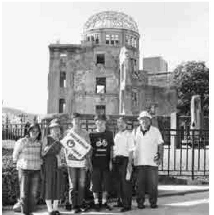
昨年の旅のようす

申 6月8日までに、電話または直接、広報秘書課広聴係(市役所第二庁舎1階 ☎042-387-9818)へ