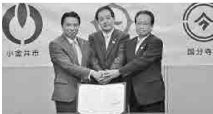
大坪日野市長(中央)と井澤国分寺市長(右)と西岡市長