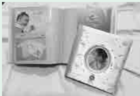
昨年度のお祝いの品