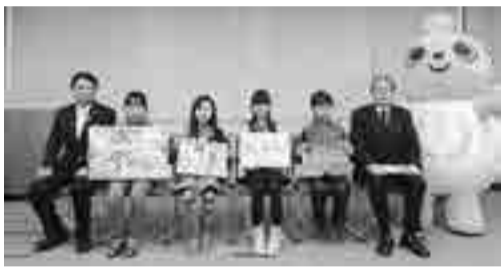
表彰式のために市役所を訪れた受賞者の皆さん