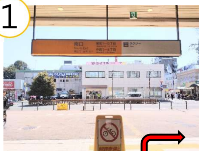
東小金井駅南口を出て、右へ。