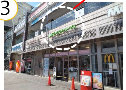
マクドナルドの隣が“ふじかわフォトサービス” です。緑色のロゴが目印。