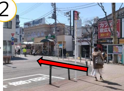
道なりに歩き、くりやま通りを 30メートルほど 進みます。