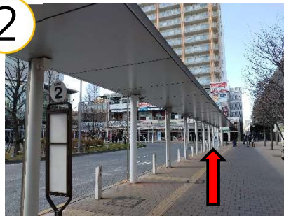
道なりに歩いていくと、正面にマクドナルドが みえます。