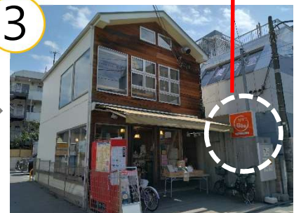
右手にセブンイレブン、その向かいのお店が “ひがこ日和”です。オレンジ色の看板が目印。