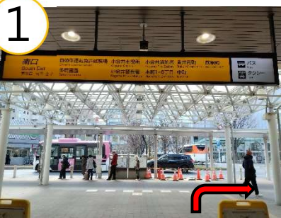
武蔵小金井駅南口を出て、右へ。