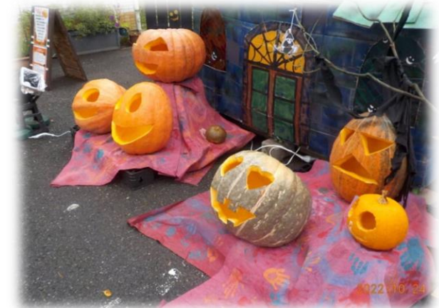
ハロウィンかぼちゃ作り・展示