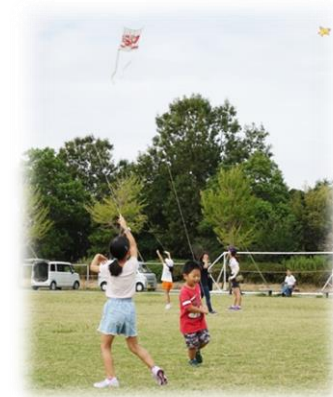
凧作り体験・凧揚げ大会