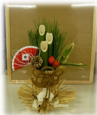
ミニ門松作り講座