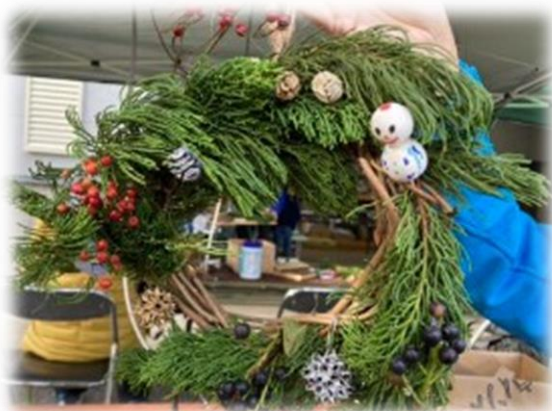
クリスマスリース作り