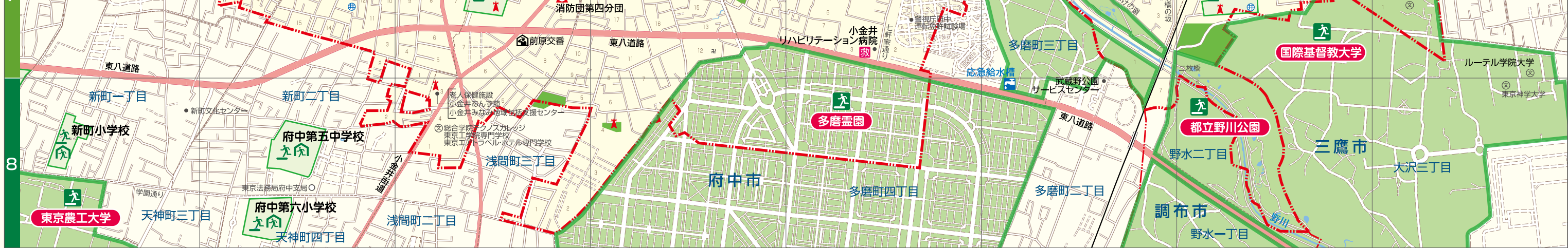
この地図の作成に当たっては、国土地理院長の承認を得て、同院発行の数値地図(国土基本情報)電子国土基本図(地図情報)及び数値地図(国土基本情報)電子国土基本図(地名情報)を使用した。(測量法に基づく国土地理院長承認(使用)R 2JHs 224)