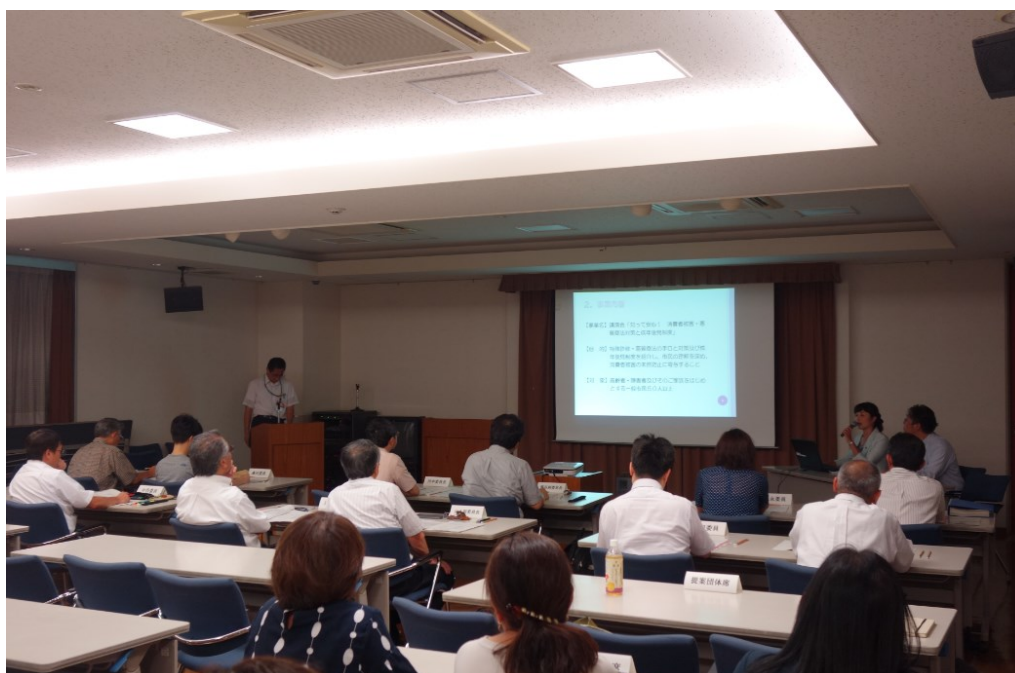
プレゼンテーションの様子

第1次審査を通過した団体について、公開プレゼンテーションとヒアリングを行います。この第2次審査に参加しないと、選考の対象になりません。日程や時間帯などの詳細は、第1次審査を通過した団体へ個別に連絡いたします。