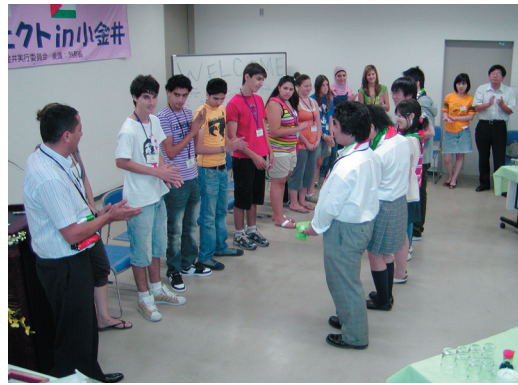
イスラエル・パレスチナ高校生から 市内高校生にプレゼントの贈呈