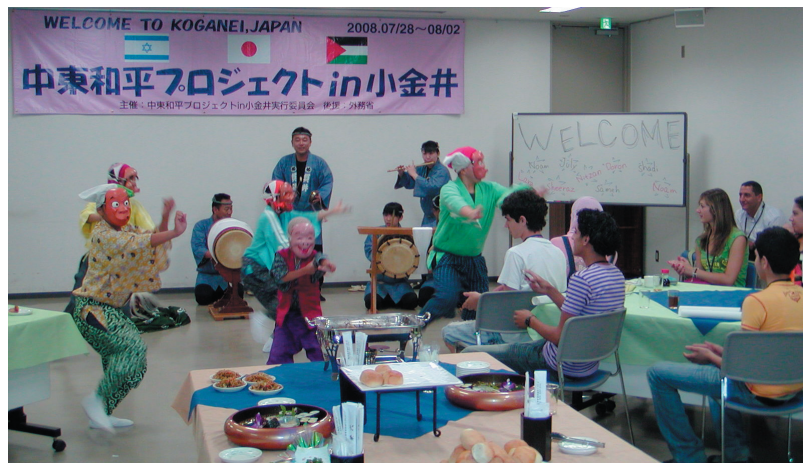
伝統芸能“貫井囃子”の鑑賞