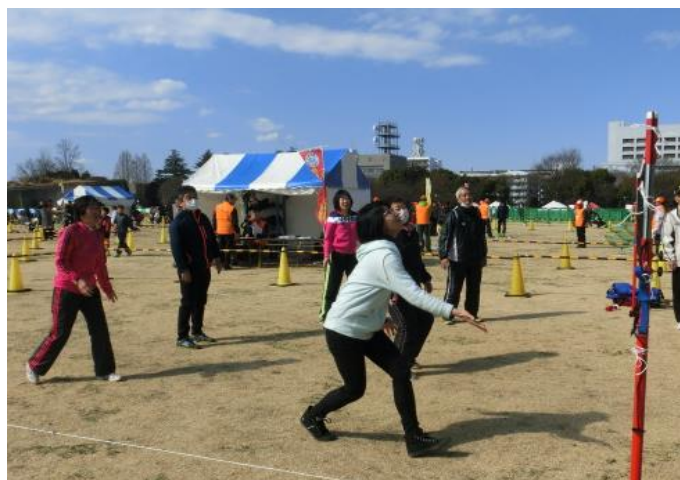
インディアカを体験

各種目それぞれに面白さがあり、今後の私たちの活動にも取り入れていきたいと考えています。