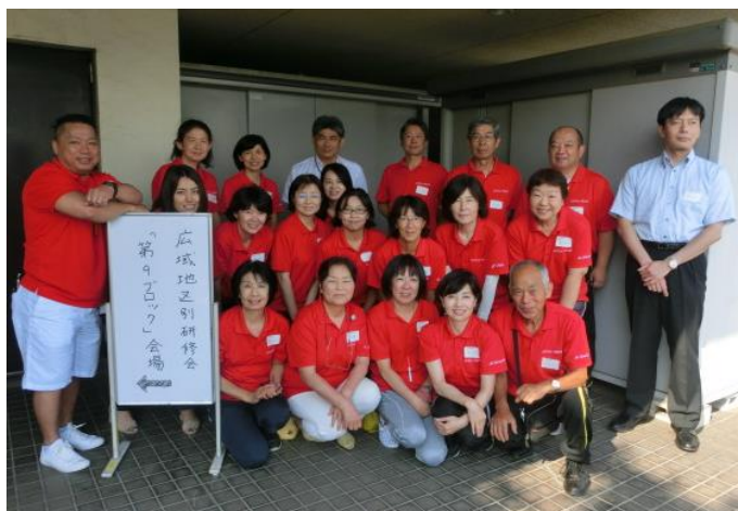
小金井市スポーツ推進委員