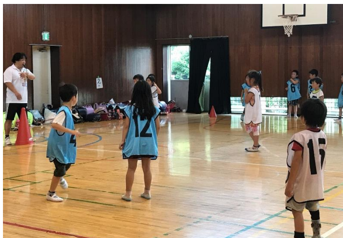
4チームでトーナメント(ドッチビー)！

学校・地域・保護者が主体となり、放課後の子どもたちの安全・安心な居場所づくりを目的として運営されています。現在、市内の全小学校で、スポーツ体験教室や英会話、工作など、それぞれ特色のある活動を行っています。