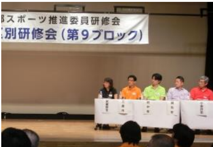
トークセッションの様子

後半の第2部では、パラリンピック種目としても注目されているボッチャの対抗試合が行われ、私たち小金井市スポーツ推進委員協議会が優勝しました。