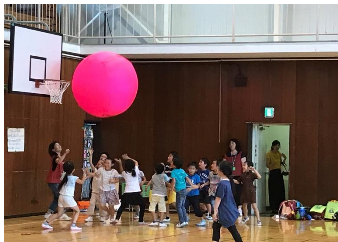
キンボールを使って追いかっこ！