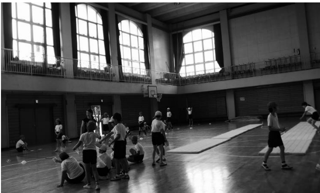
第三小学校の様子

5月31日・6月1日・2日に実施された市内小学校の児童体力テストに補助員として参加しました。 当日は、屋内では上体起こしや反復横飛び、校庭ではシャトルランやソフトボール投げなど、さまざまなテストが行われ、各委員が協力してスムーズな測定を行うことができました。