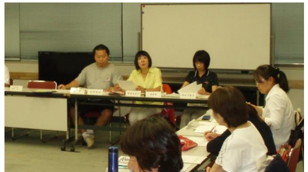
5月のスポーツ推進委員協議会の様子