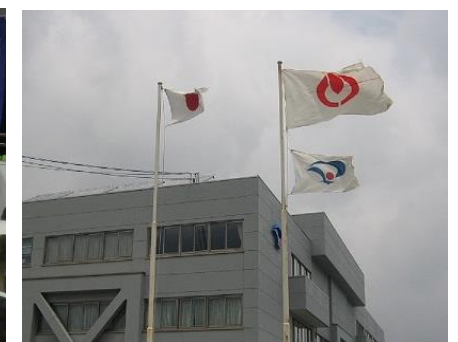
(左) JR東小金井駅南口広場でのラジオ体操の様子 (中央) 集計センター 電話・FAX・メールでの参加報告を21時半まで受付 (右) 大仙市役所（秋田県）庁舎前 両市の健闘を称え小金井市旗を掲揚