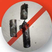
(処理施設で発火した 小金井市のごみ)