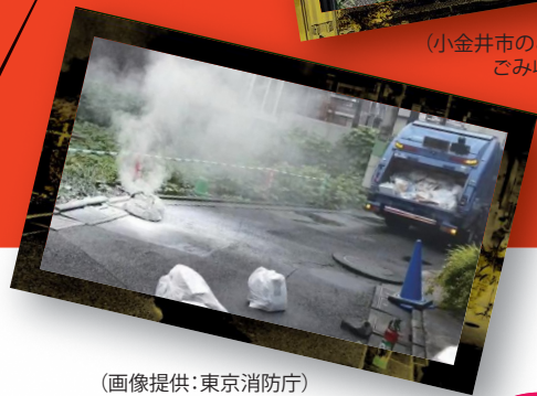
(小金井市のごみが発火した ごみ収集車)