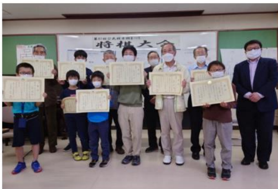
第41回公民館本館まつり将棋大会入賞者の皆さん