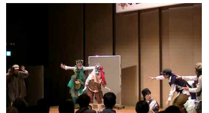
2018年市民文化祭 「真夏の夜の夢」公演

全くの初心者の方でも大歓迎！少しでもご興味がありましたら一緒に舞台を作ってみませんか？