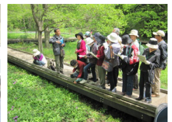
【公民館主催事業の様子】