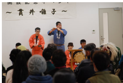
オープニングイベント「貫井囃子」

イベントの前半は、小金井市無形文化財指定の「貫井囃子」、後半は東京学芸大学の卒業生が結成したポップス&クラシックグループ「エバリー」の演奏で、館内が軽快なリズムで満たされた楽しいイベントになりました。