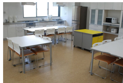
キッチン併設 生活室B

生活室は壁面キッチンとテーブル・イスがありますので、お茶会や食事を兼ねた打ち合わせや、子どもを囲んだイベントにも向いています。