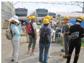
旧武蔵小金井電車区の見学

実施前の講師との打合せで是非、JR中央線関連施設（旧武蔵小金井電車区、武蔵小金井駅など）の見学を、との提案があり、実現するまでには苦労しましたが、先方の職員の方もこの講座の趣旨を分かっていたさき旧武蔵小金井電車区内、武蔵小金井駅構内も見学にごぎつけたことは幸運であり、参加者も減多に入ることができないうえに、解説までしていただき貴重な体験になったと思います。