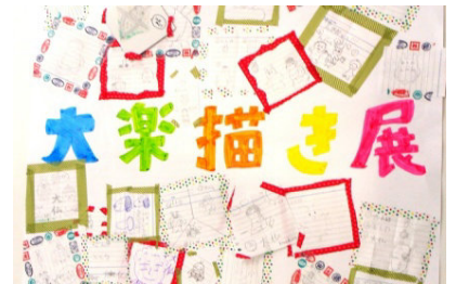
7月に開催した「大衆描き展」