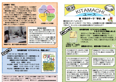
KITAMACHIユース第5号テーマ「学ぶ」

毎月テーマをきめて、公民館からはテーマにあった若者関係の講座、イベントの案内や利用者の声など、また図書館からはテーマに合った本を紹介しています。