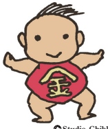
つまんちゃん