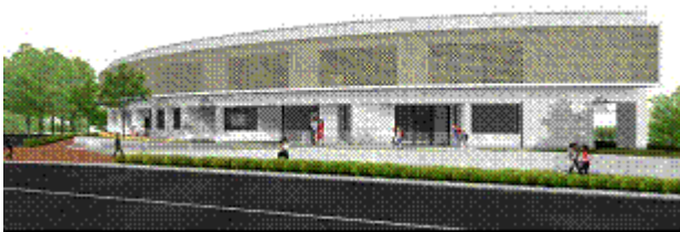
(仮称) 貫井北町地域センター完成予想図 所在地 小金井市貫井北町1丁目11番12号

工事中の外壁に掲示されている工事の途中経過の写真や、完成予定図を、立ち止まって眺める市民の方々も見かけられ、新しくできる地域センターへの関心の高さが伺えます。