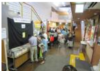
緑センター 1階の様子

ロビーでは、ひよこの折り紙を習い、押し花や絵など、みな素晴らしい作品ばかりで、皆こんなに人生を楽しんでいるんだなあと感動しました。