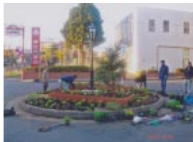
新小金井駅前 フラワーガーデン

私がこの土地に来たのは昭和30年の小学校4年生の時でしたので、この商店会の始めから今日までの55年余見ている次第です。その頃は、新小金井のホームに立つと今の東小金井方面を見ると市立第三小学校の校庭が見え、西の方向を見ると富士山が大きくみえる都心からわずか30分たらずのこの商店会も早55周年になります。