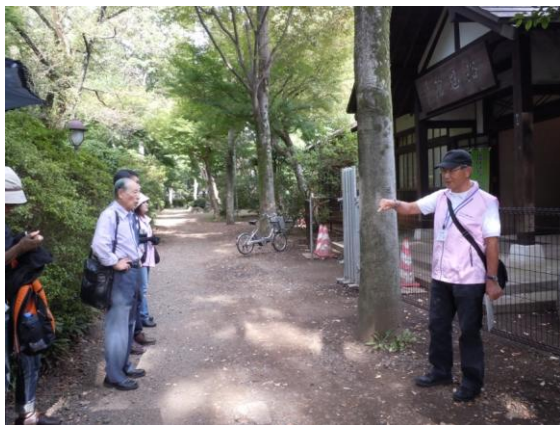
よくおんかん まえ はなし うかが 浴恩館の前でお話を伺う

6.2km、約2時間の散策で歴史の旅を楽しみました。江戸時代に上水路が完成して農地が大きく変わったことや、水路沿いの山桜が名所となりお茶屋さんが出来てにぎわったことなど、今後学習者の皆さんにもお伝えしていきたいと思ひます。