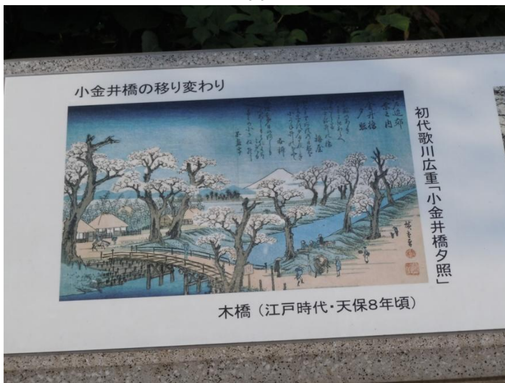
ゆうめい うきよ えし うたがわひろしげ えが えどじだい こがねいばし 有名な浮世絵師・歌川広重が描いた江戸時代の小金井橋