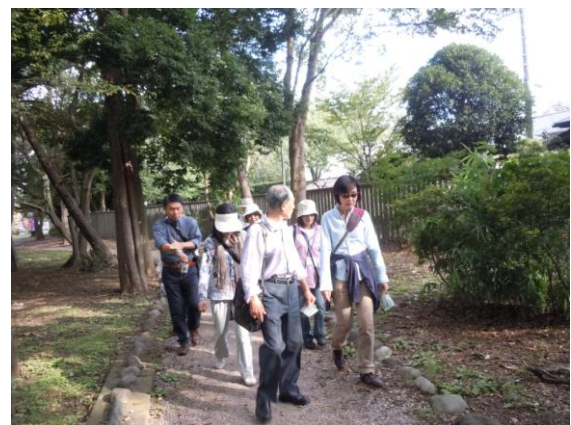
さくらちょうゆうほどぎ さんさく 桜町遊歩道を散策