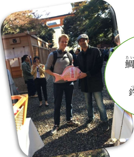
たい 鯛のおみくじ 釣れたかな？