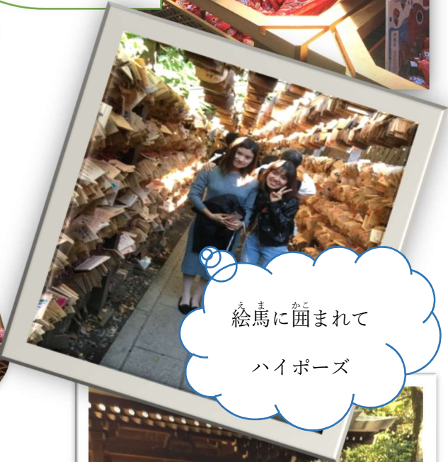
ま 絵馬に かこ まれて ハイポーズ