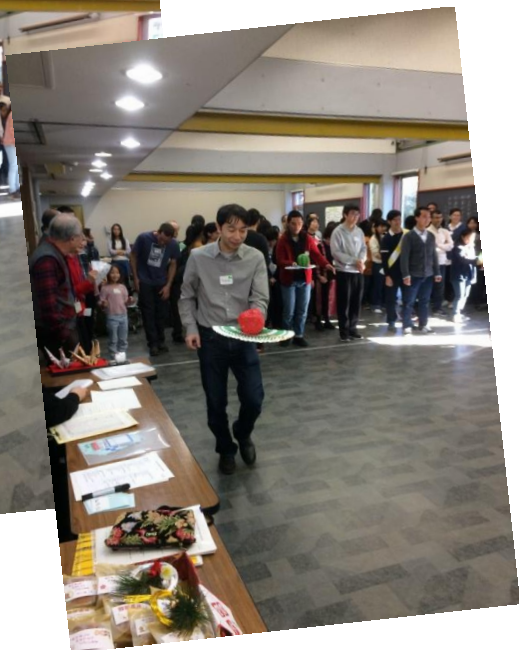
おと はこ 落とさないで運ぶぞ！