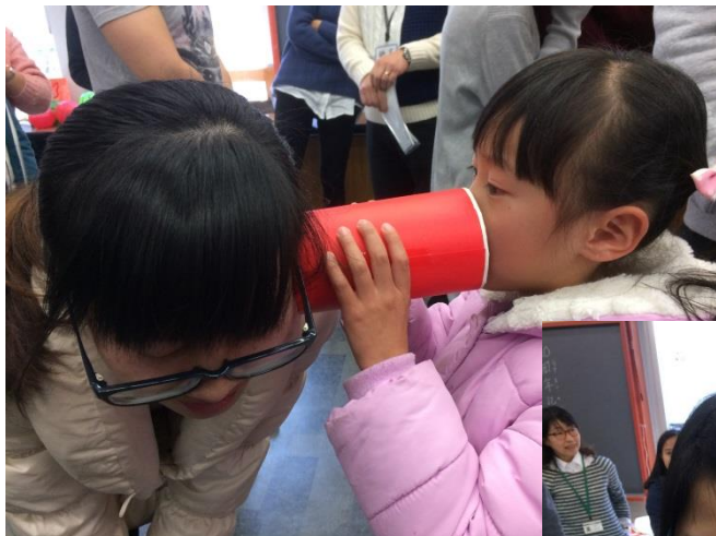
でんごんげーむ 伝言ゲーム