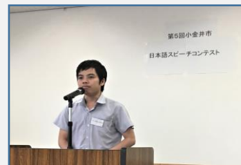
ぶ みん ずん(ベトナム) ブミンズン(ベトナム) わたし にほん 「私の日本」