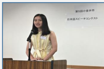
しょう い ちゅうごく 肖 羿 (中国) 「一人で大丈夫？」