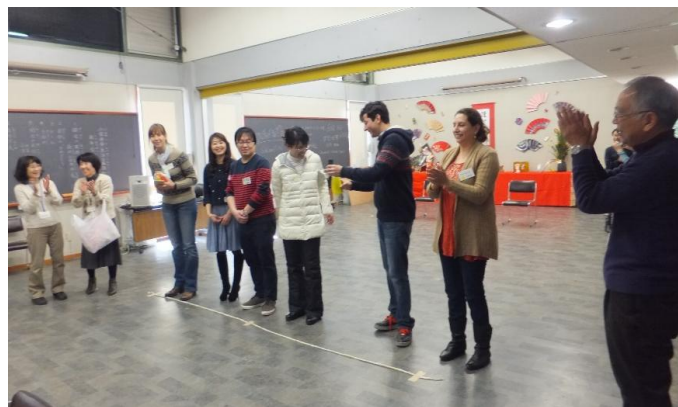
ねっせん せい きいろぐるーぶ 熱戦を制したのは黄色グループでした。