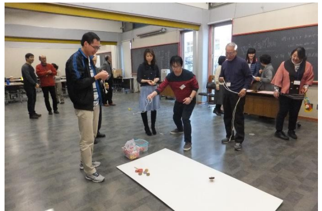
にしおかしちよう か げーむ さんか 西岡市長も駆けつけてゲームに参加してくださいました。