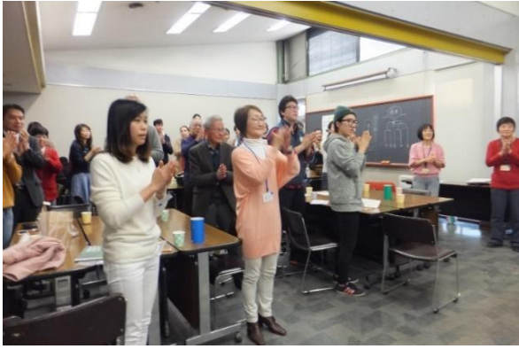
さんさんなびょうし ひら 三々七拍子でお開きとなりました。