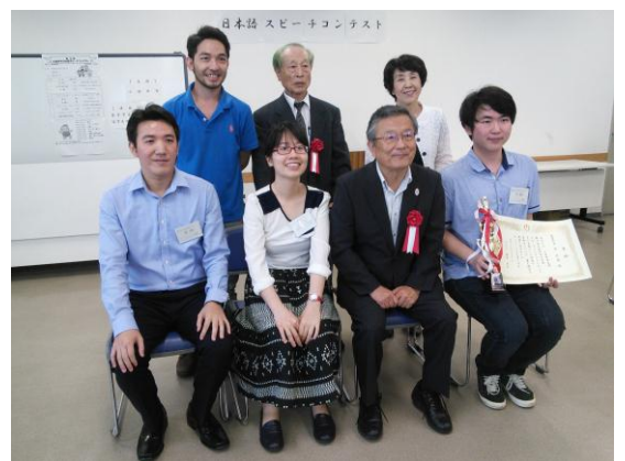
いなばしちょう ぜんれつみぎ ふたりめ とも 稲葉市長(前列右から二人目)と共に