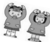
「コミュニケーションのワーク」 “じゃんけん勝負”

☆講習会では、お子さまを安全安心にサポートするための講義を受けました。参加者からは「自分の子育ての時に聞きたかった」「これからのサポート時に役立てていきたいと思いました」などの感想がありました。