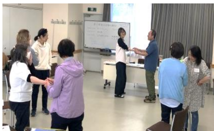
「子どもの遊びと生活」 “ちょちょと手遊び”