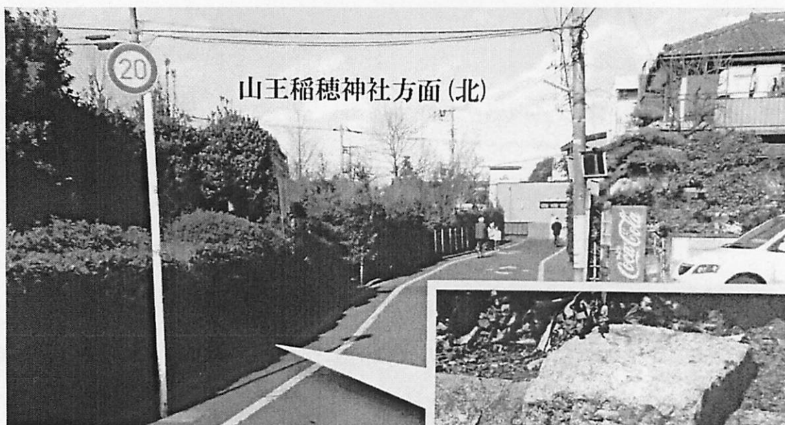
文化財追加登録候補の石杭の現況