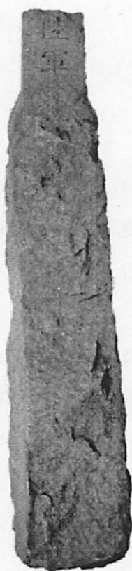
文化財登録済みの石杭