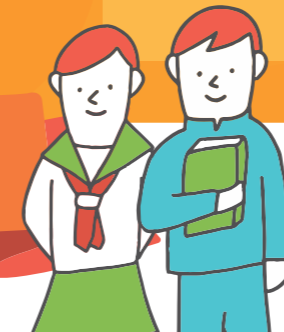
図1 どんな相談があったのかな

何か話したいこと、困っていることがあるときは、気軽に相談室に来てください。まわりの人に言いたいけど言えないときには代わりに伝えることもできます。