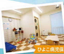
ひよこ病児保育室