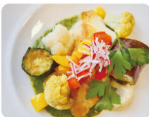
家庭料理に近い自慢のお食事です