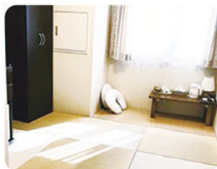
産後ケア卒業を実施中です

妊娠・分娩～産後まで、皆さまに寄り添ったケアを提供しています。なんでもご相談ください。