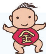
小金井市イメージキャラクター こさんちゃん

小金井市のイメージキャラクター「こさんちゃん」は、市の名誉市民である宮崎駿氏に、制作していただいたものです。 宮崎氏からのメッセージ「子どもが元気な町が発展するんです。」