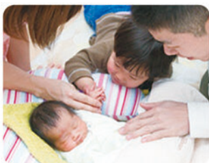
フリースタイル分娩ができます